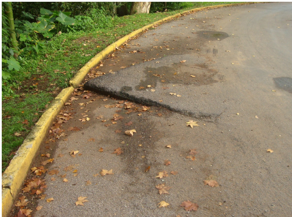
CURVA DA PRAÇA – DESNÍVEL ACENTUADO TAMANHO = 2.00 m.(L) X 4.00 m.(C)