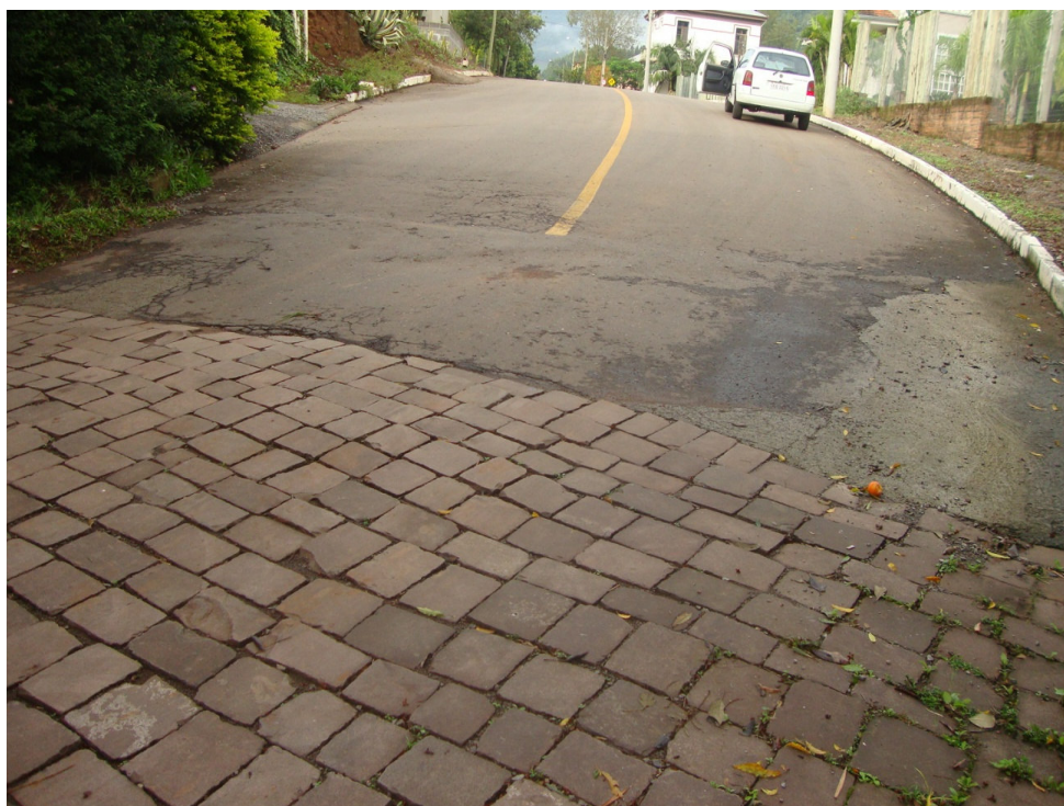
INICIO DO CALÇAMENTO DANIFICADO TAMANHO = .00 m.(L) X .00 m.(C)