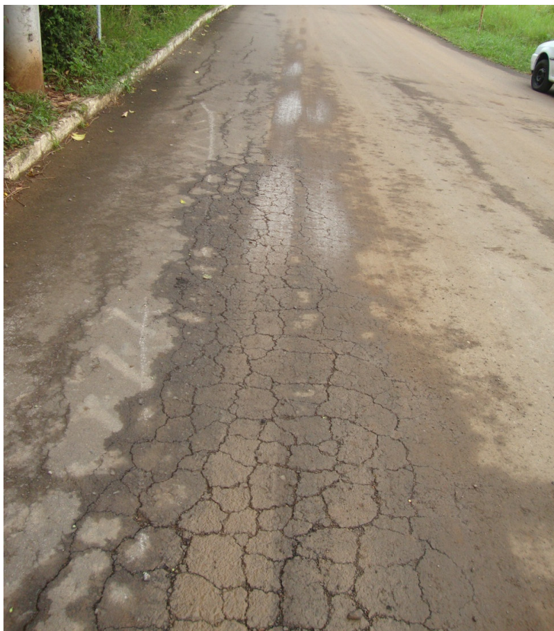
ESCOLA - PONTE - ASFALTO DANIFICADO - RACHADURAS E BURACOS (3)