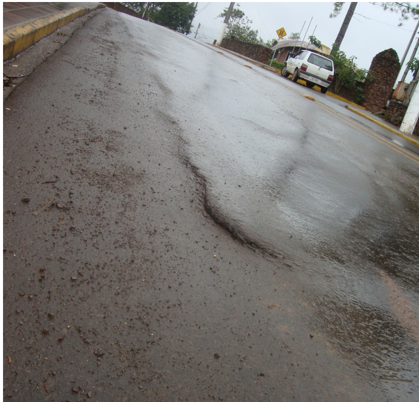
BRIGADA - ASFALTO DANIFICADO, DESNÍVEL. (2)