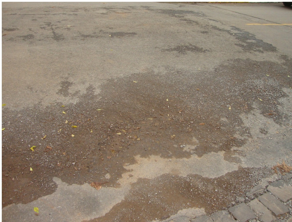
RUA CÉSARE APPIANI (ESTEVÃO REMUS) - ASFALTO DANIFICADO