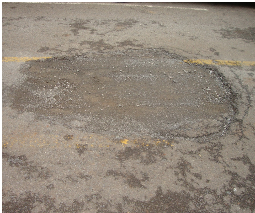
RUA CÉSARE APPIANI (NEI) - BURACO TAMANHO = 2.00 m.(L) X 3.00 m.(C)