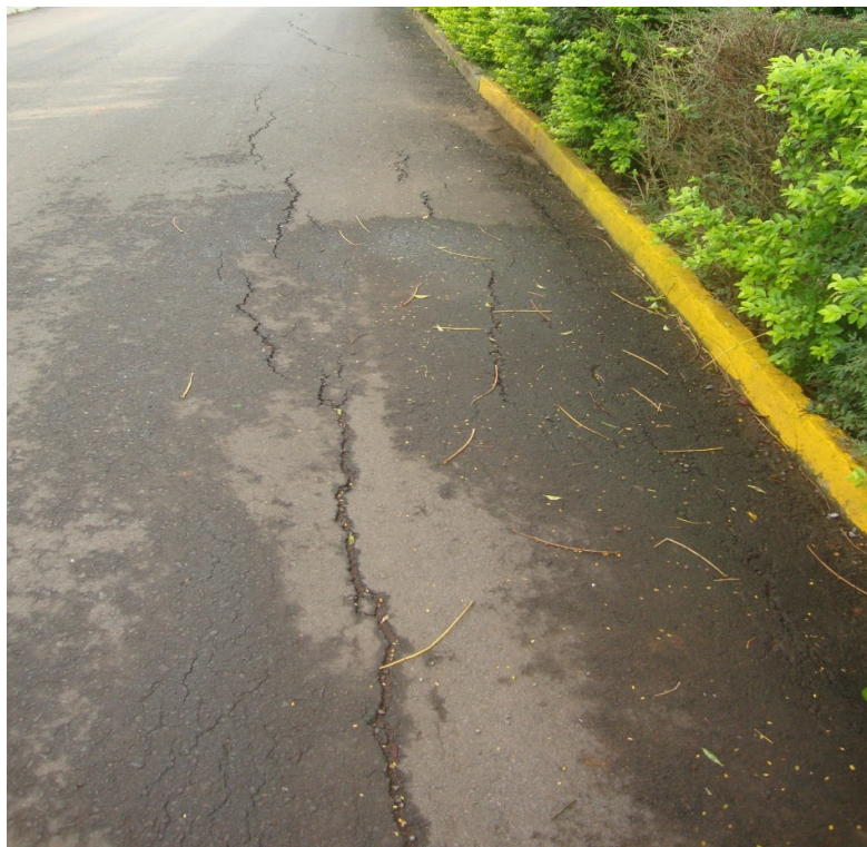
ESCOLA - ASFALTO DANIFICADO – DESNÍVEL E RACHADURAS