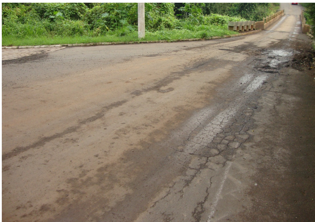
ESCOLA - PONTE - ASFALTO DANIFICADO - RACHADURAS E BURACOS (2)