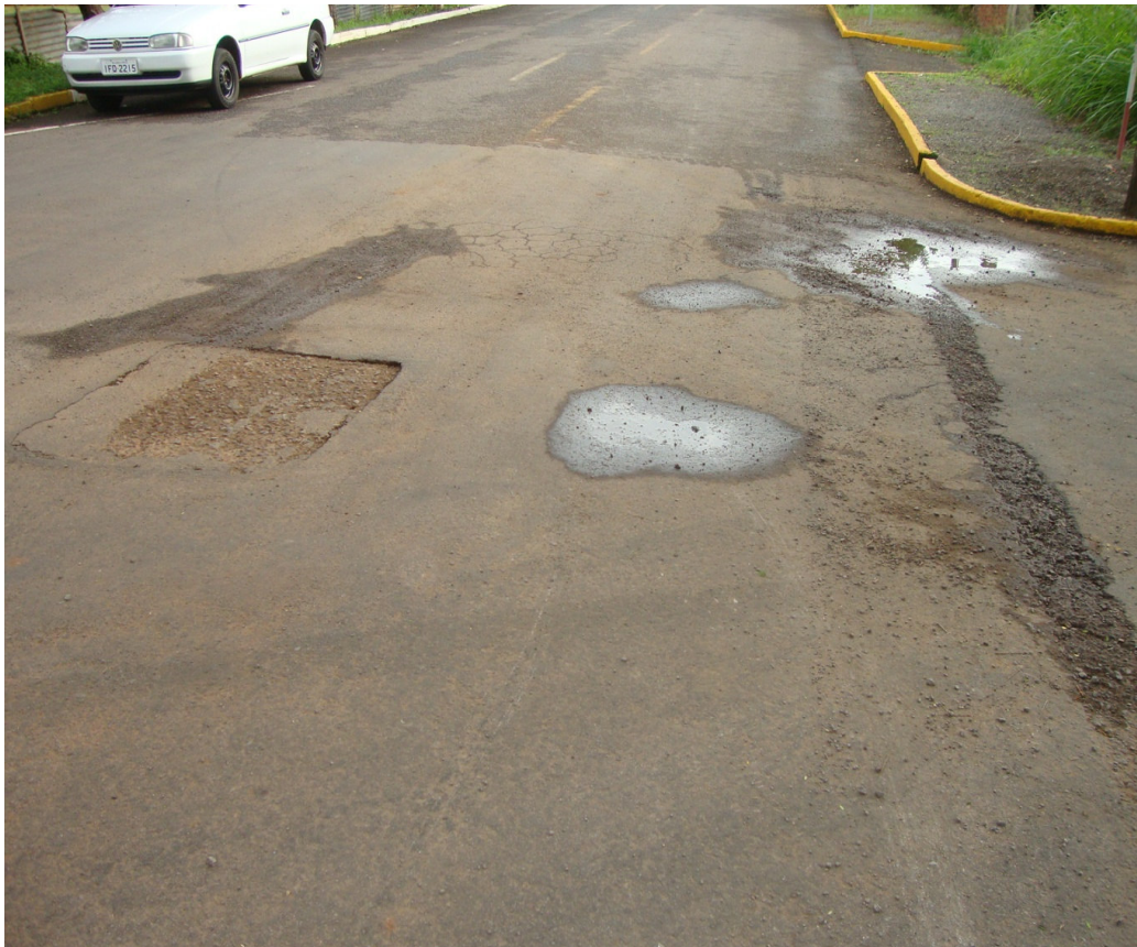
RUA CÉSARE APPIANI - PRAÇA KOFF / CAMPO – ASFALTO DANIFICADO, RACHOS.