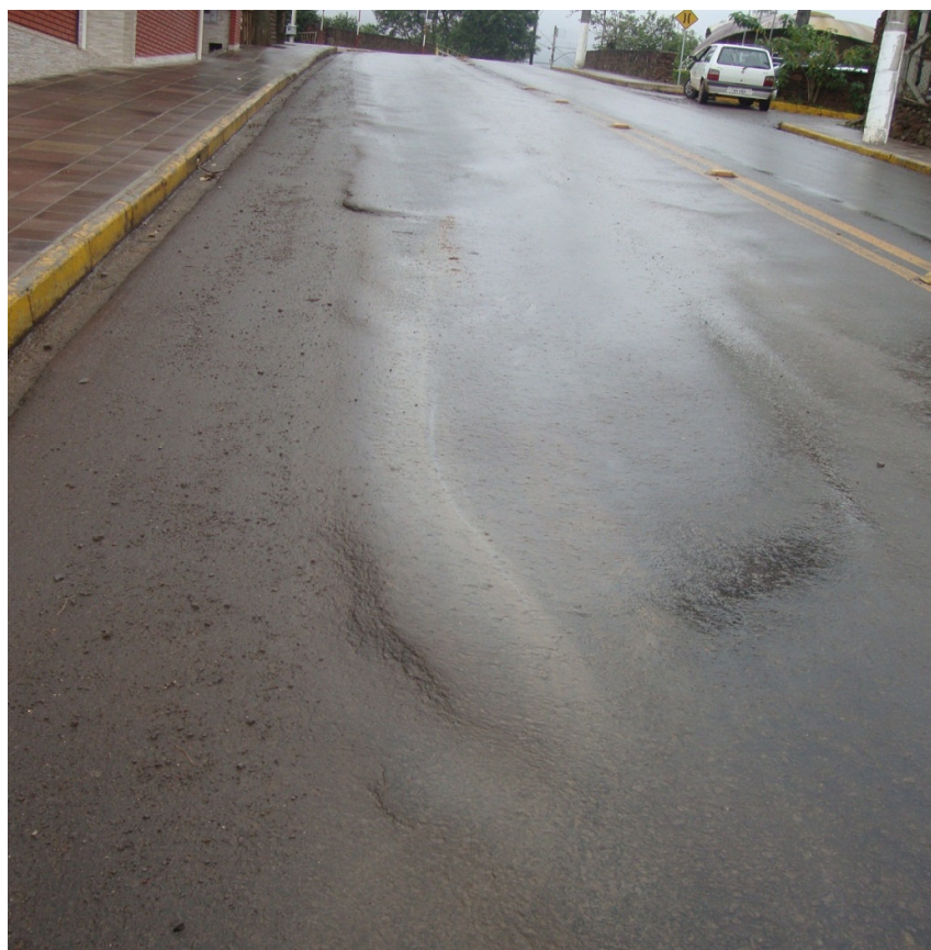
BRIGADA - ASFALTO DANIFICADO, DESNÍVEL. (1)