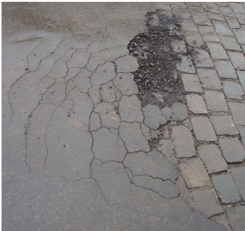
FINAL DO CALÇAMENTO COOPERATIVA - ASFALTO DANIFICADO TAMANHO = 2.00 m.(L) X 7.00 m.(C)