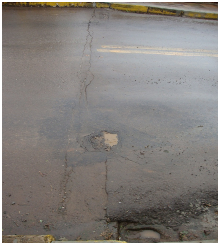
PONTE SECA - BRIGADA - RACHOS E BURACOS TAMANHO = 2.00 m.(L) X 5.00 m.(C)