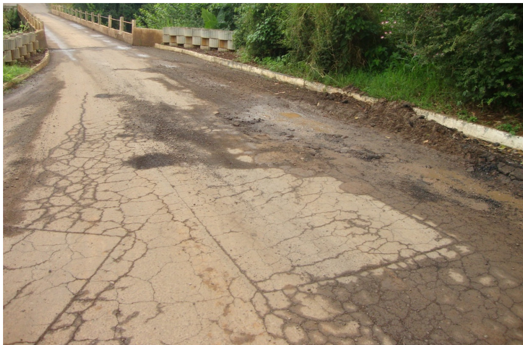
ESCOLA - PONTE - ASFALTO DANIFICADO - RACHADURAS E BURACOS (1)